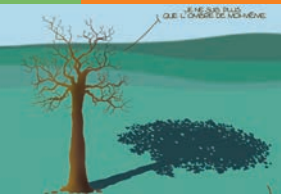
Dessin de Dobritz pour annoncer le débat sur « Eau et agriculture » et changements climatiques... (collection Nuage Vert)