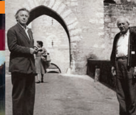
André Breton et Benjamin Péret à Cahors pour les Citoyens du monde