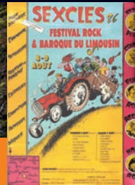
Affiche du festival rock punk de Sexcles en 1986 (collection Nuage Vert)