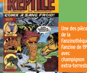
Une des pièces de la Fanzinothèque : Fanzine de 1995 avec champignon extra-terrestre