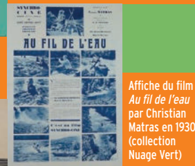
Affiche du film Au fil de l'eau par Christian Matras en 1930