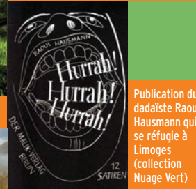
Publication du dadaïste Raoul Hausmann qui se réfugie à Limoges (collection Nuage Vert)