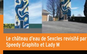
Le château d'eau de Sexcles revisité par Speedy Graphito et Lady M