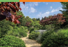
Les jardins Sothys à Auriac