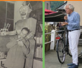
Boris Vian, auteur de la pièce Série blême, ici en décembre 1953 à la librairie La Balance