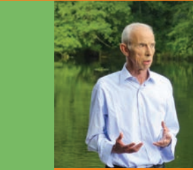
L'écrivain Pierre Bergounioux à Histoires de Passages