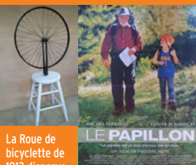
La Roue de bicyclette de 1913 disparue et reconstituée par Jean-François Beaud