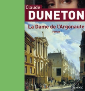
Le roman de Claude Duneton sur Jeanne Villepreux-Power