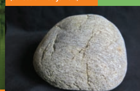
Galet roulé par la Dordogne, un des « cailloux d'Argentat » dans cette expo qui évoque aussi les mines (collection Nuage Vert)