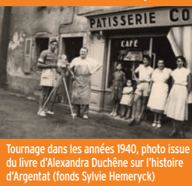
Tournage dans les années 1940