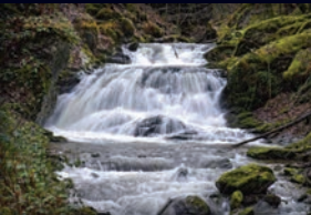
La cascade la Moulinotte à Auriac en Xaintrie